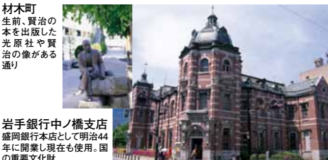
材木町 生前、賢治の本を出版した光原社や賢治の像がある通り