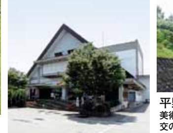
平野政吉美術館 美術館の大壁画「秋田の行事」は平野政吉と親交のあった画家・藤田嗣治の作品