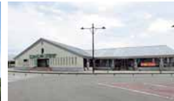
道の駅なかせん こめこめプラザ 一角には米の加工所や食事処もあり、おいしい郷土料理が味わえる