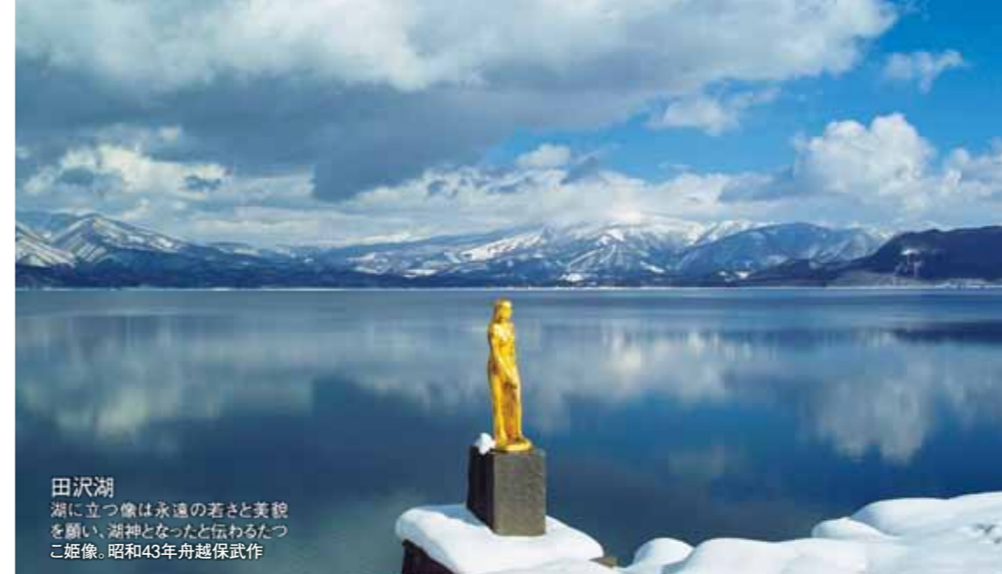
田沢湖 湖に立つ像は永遠の若さと美貌を願い、湖神となったと伝わるたづこ姫像。昭和43年舟越保武作