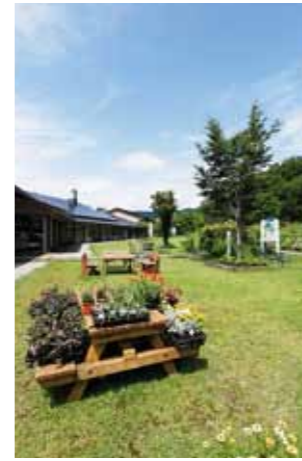
田沢湖ハーブガーデン ハートハーブ エッセンシャルオイル作りを始め、ハーブを使ったさまざまな体験も充実