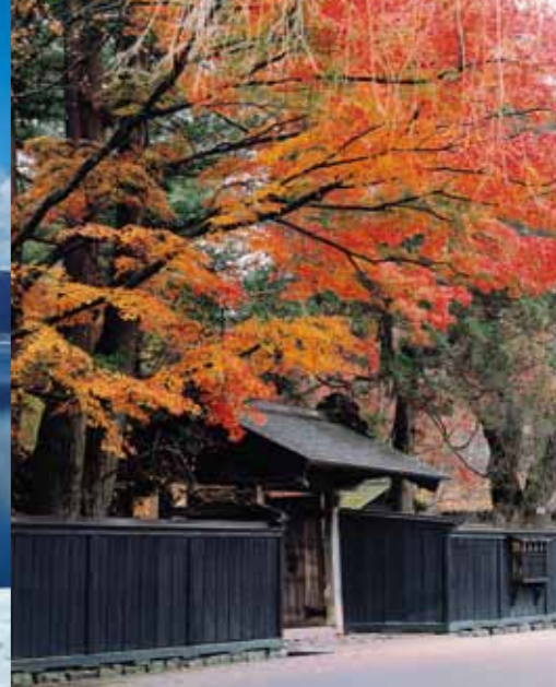
角館武家屋敷 藩主・芦名義勝が治めていた武家の居住区。武士の階級で黒塀の高さが違う